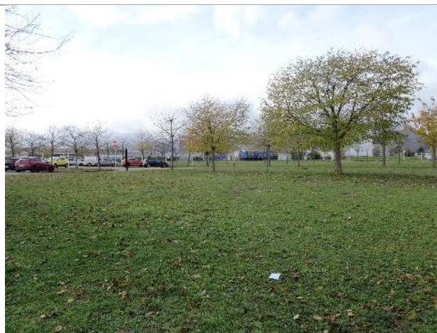
Espaces verts entretenus (85)