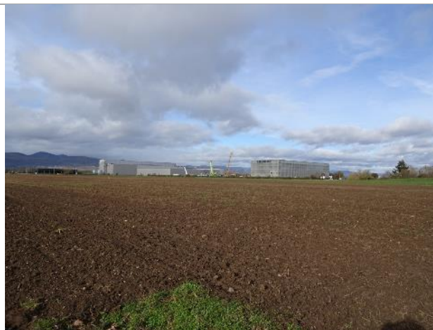
Terre agricole labourée (82)