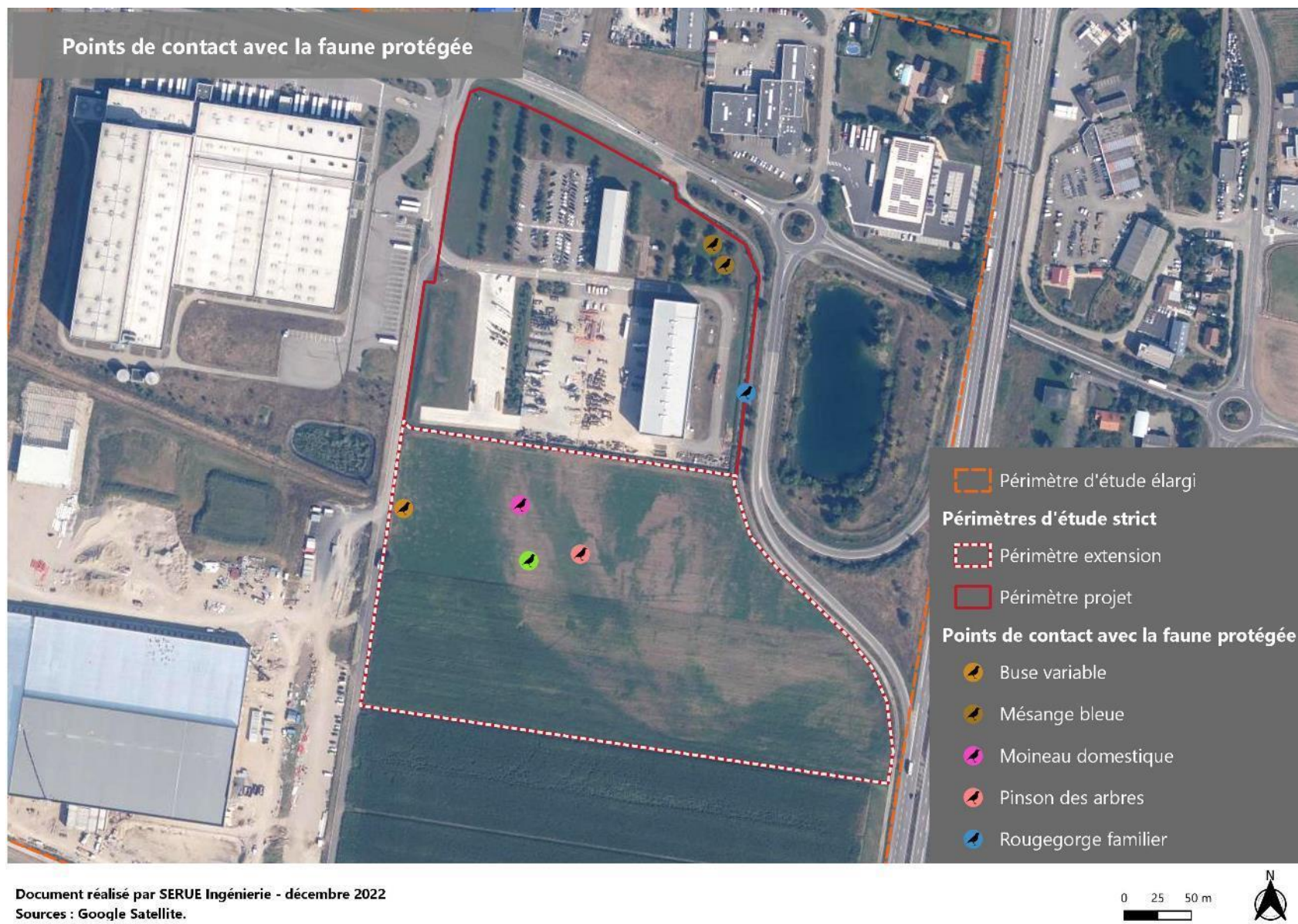
Figure 8 : Cartographie des points de contact avec l'avifaune protégée sur site