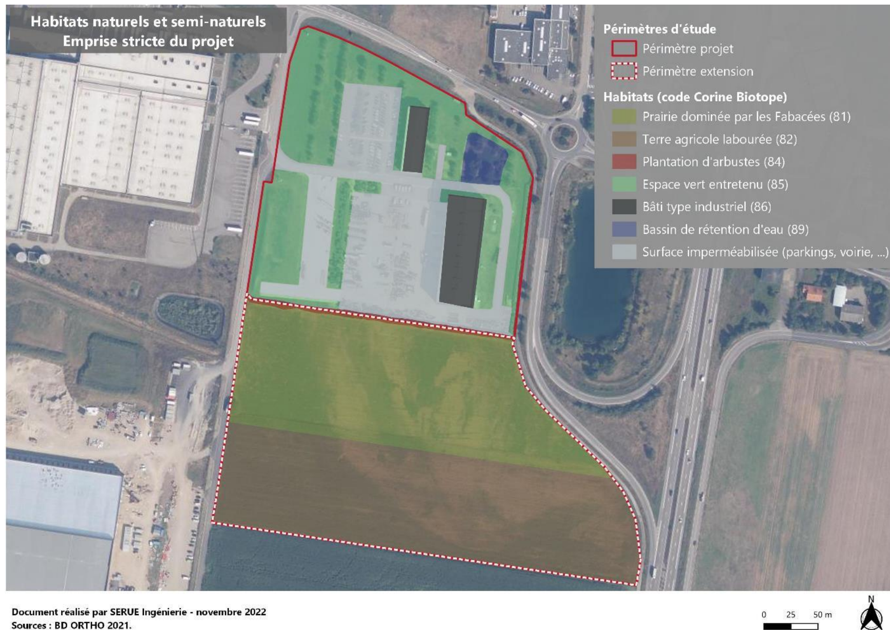
Figure 3 : Cartographie des habitats naturels identifiés au sein de l'aire rapprochée