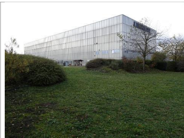
Bâti type industriel (86.3)