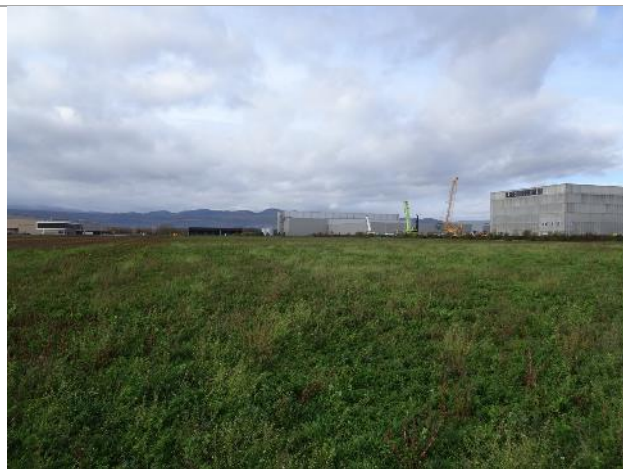
Prairie dominée par les Fabacées (81)