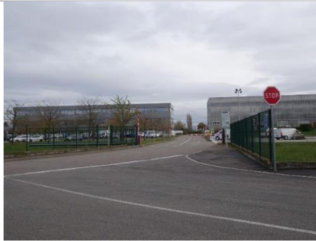
Surfaces imperméabilisées (parkings, voiries, ...)