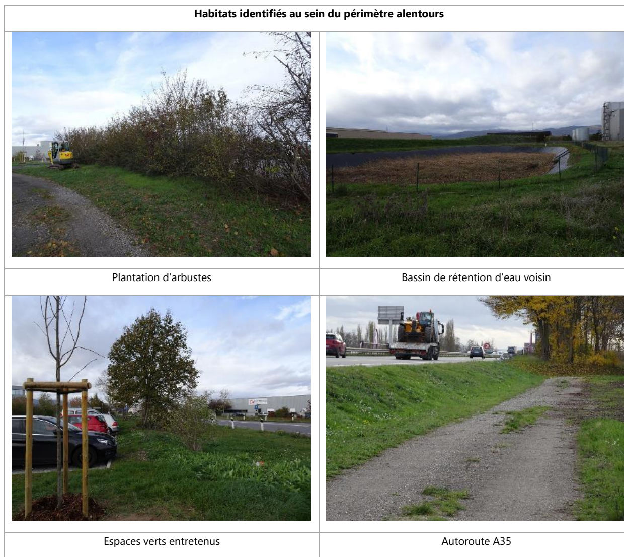
Figure 5 : Photographies des habitats identifiés au sein du périmètre alentours – SERUE Ingénierie