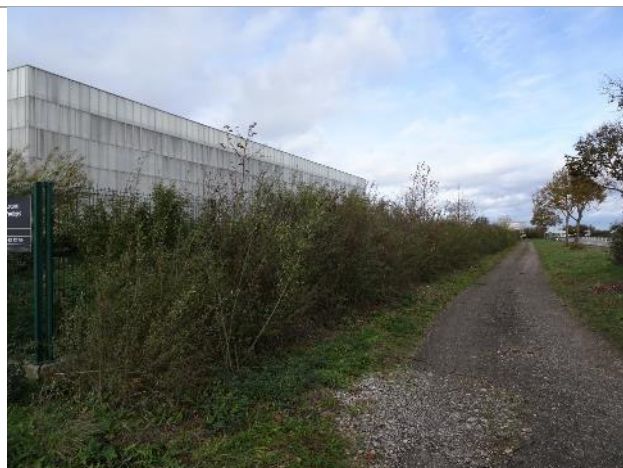
Plantation d'arbustes (84)