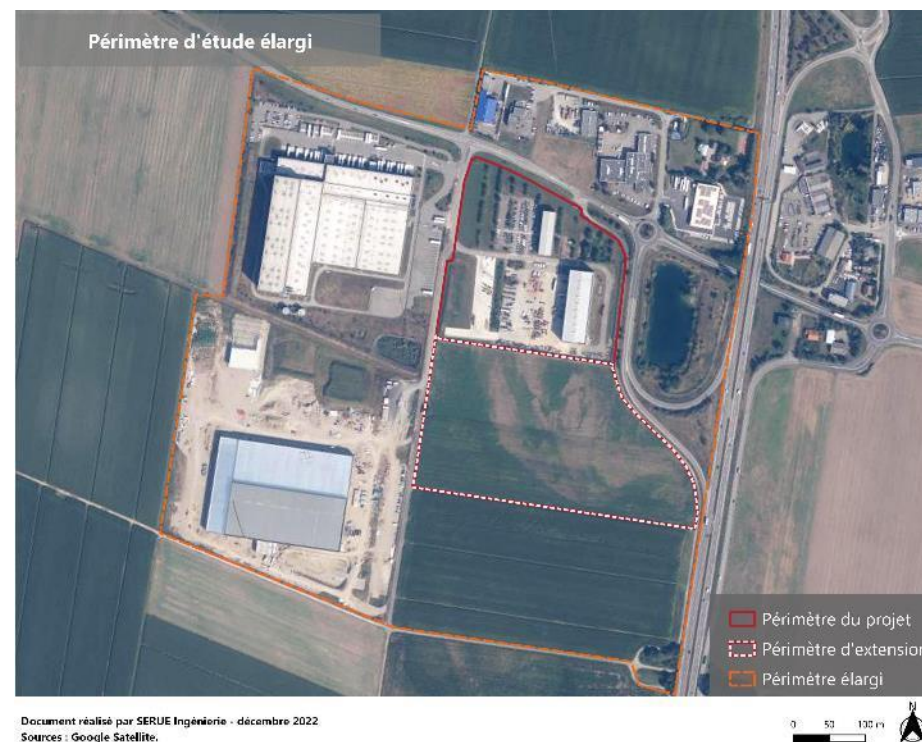
Figure 1 : Cartographie du périmètre rapproché et du périmètre alentours

Toutes les observations du périmètre élargi et ainsi hors projet strict seront précisées dans les tableaux de synthèse des inventaires et sur les différentes cartographies illustratives.