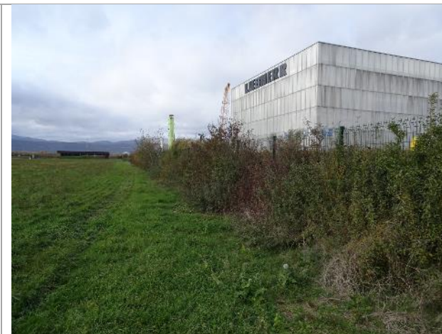
Plantation d'arbustes (84)