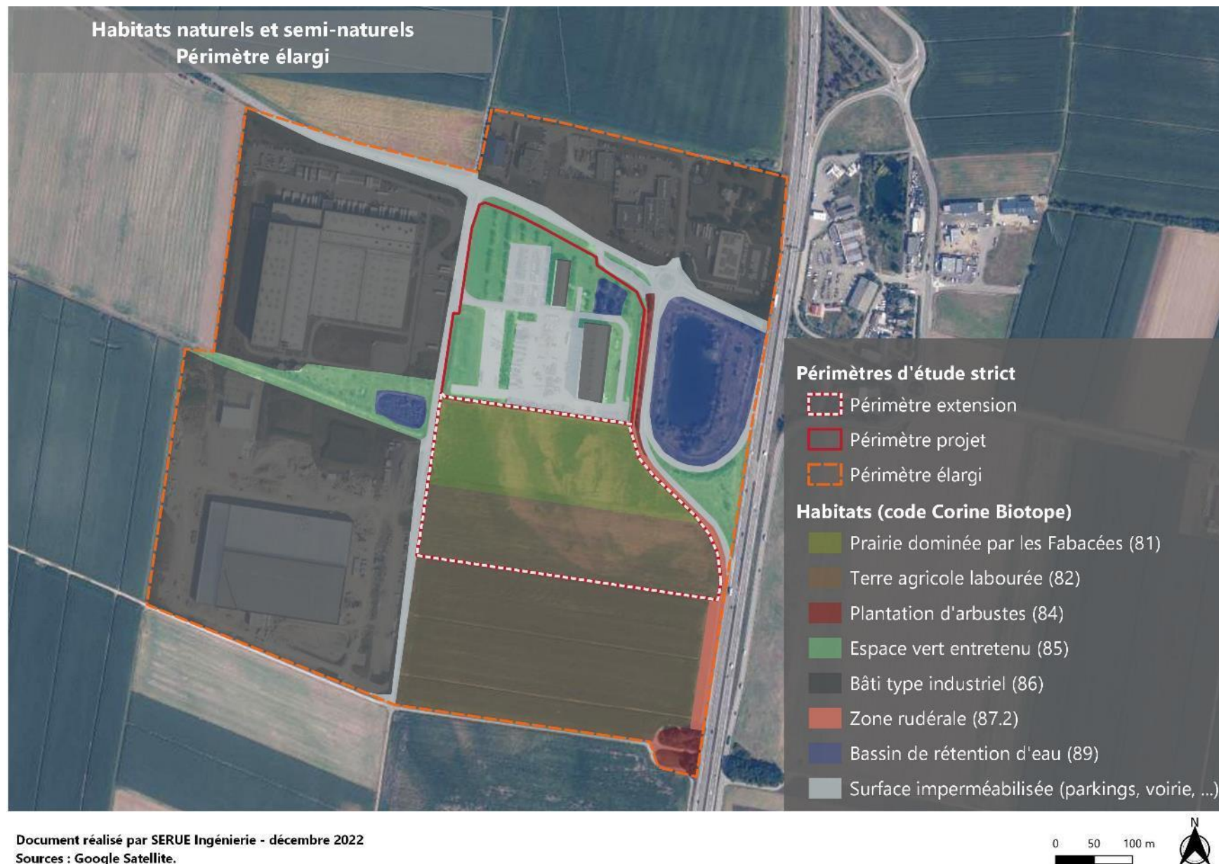
Figure 6 : Cartographie des habitats identifiés dans le périmètre alentours