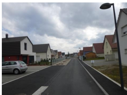
Nouveaux quartiers à Niederentzen

A Niederentzen, qui a connu un développement résidentiel très important sur la période étudiée. 8,25 ha ont été urbanisés pour de l'habitat. Il s'agit très largement de grandes opérations organisées type lotissements. On rappellera ici, que selon les recensements de l'INSEE, Niederentzen est passée de 363 habitants en 2007 à 544 en 2012. Ces chiffres soulignent l'attractivité de la commune, et plus largement de la CCCHR qui profite d'une bonne situation et d'une bonne accessibilité.