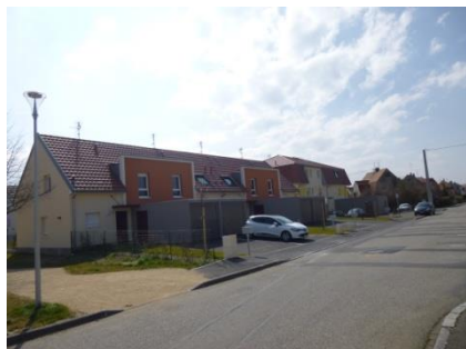
Densification de la cité minière, et nouveau quartier au Sud d'Ensisheim.

A Ensisheim, on recense 18 ha de foncier mobilisés pour l'habitat. Il s'agit de comblements de dents-creuses, mais surtout de création de nouveaux quartiers résidentiels.